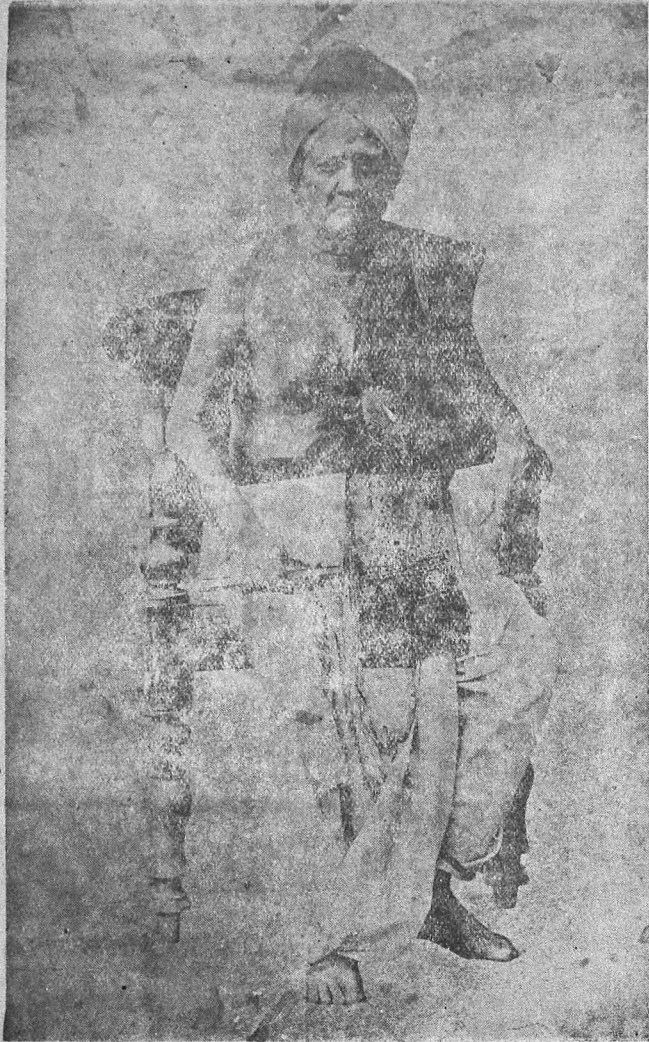
பரம்மஹீ ஸுப்பராம தீக்ரீதர் 1839-1906

ஹைக்ரீட் ஹைப்ரதாயப்ரதக்ரீனி தீரந்த கர்த்தா