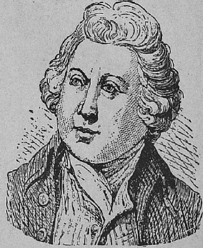
சர் றிச்சார்ட் ஆர்க்ரைட்