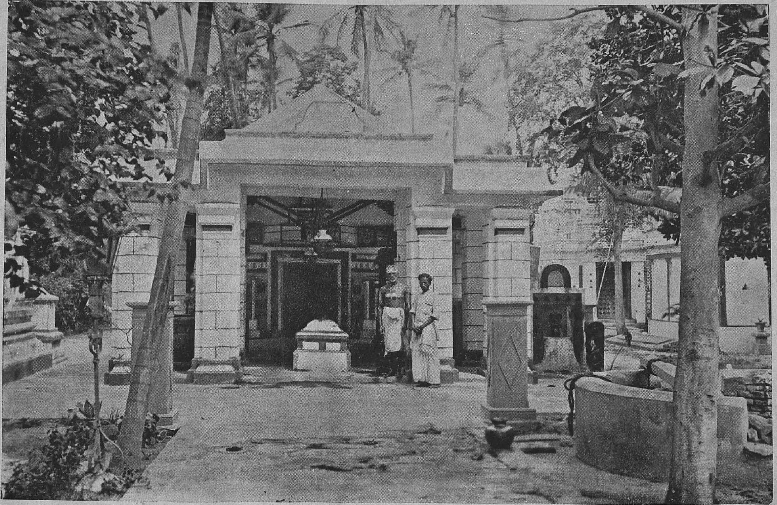
மயிலைத் திருவள்ளுவர் கோயில்