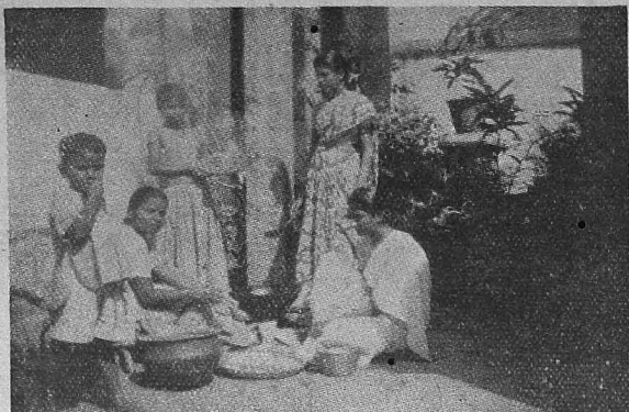
Indian sweets prepared by the Junior are seen being sold to the School Children.