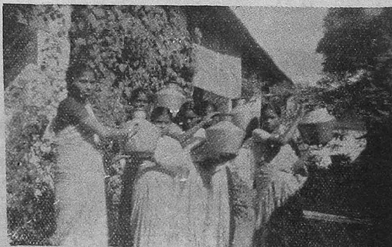
Juniors Presenting the Zinc Pots, purchased from the Group Fund, to the School for the use of School-Garden.