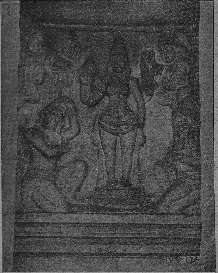
1. மாமல்லபுரம் திருவளபதி இரதத்திலுள்ள துர்ச்சையின் உருவம்.