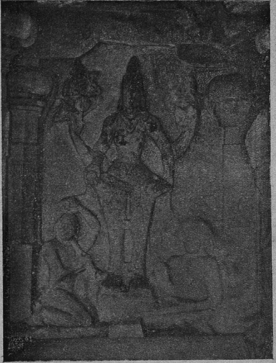
3. திருச்சி இட்பள்ளிக் கீழ்க் குதிரையிலுள்ள சிற்பம்.