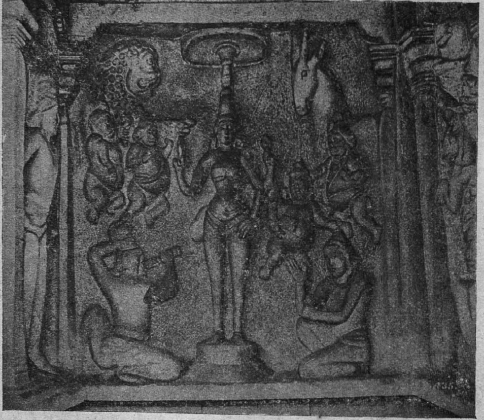
2. மாமலிபுரம், வராஹமண்டபச் சிற்பம்.