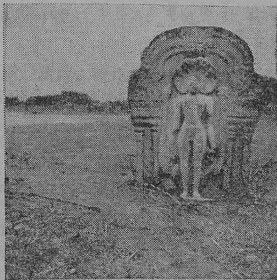
சமண தீர்த்தங்கரர் உருவச்சிலை

தகடுரின் கோட்டைப் பகுதி என்று கூறப்படும் இடத்தில் சிவன் கோவில் ஒன்றும் பெருமாள் கோவில் ஒன்றும் நன்னிலையில் காணப்படுகின்றன. அம்மன் கோவில் அடியில் கல்வெட்டுக்கள் காணப்படுகின்றன. அக்கோவிலின் உட்புறத்தில் அதியமான் கோட்டைக்குச் சுரங்கப்பாதை ஒன்று இருந்தது என்று கோவிலார் கூறுகின்றனர். அக்கோவில் கல்வெட்டுக்களில் “கொங்குநாட்டுத் தகடுர்” என்ற தொடர் காணப்படுகிறது.