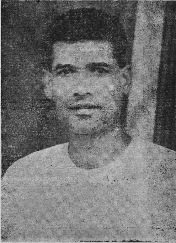
ஆசிரியர் : ஜமதக்னி