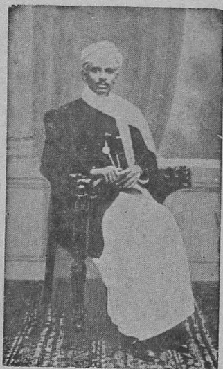
ஆசிரியர் ந. மு. வேங்கடசாமி நாட்டர்